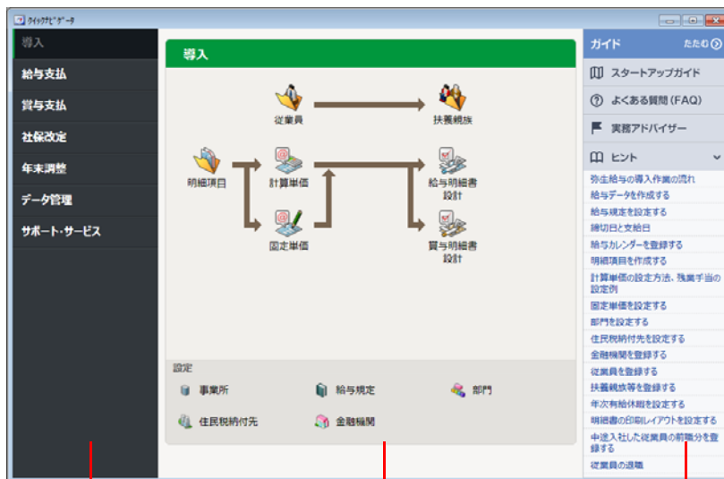
カテゴリメニュー