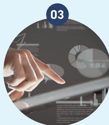
結果確認・ご契約